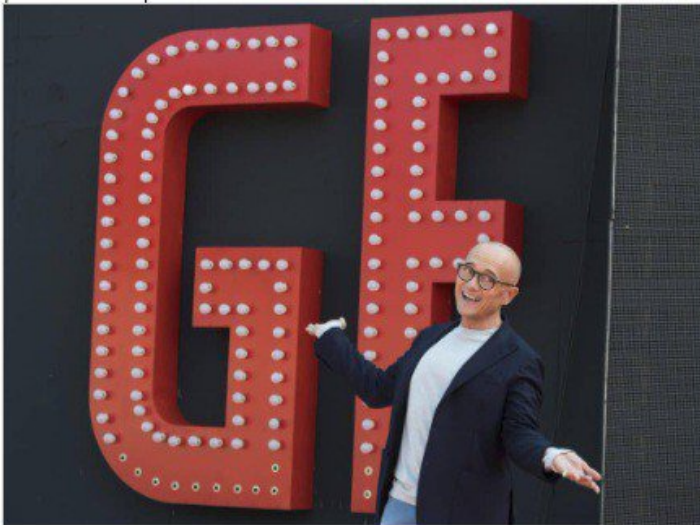
Alfonso Signorini nel corso del photocall del "Grande Fratello VIP" a Roma, 21 settembre 2018.

meno di ventiquattro ore dell'ingresso in casa si era guadagnato il biglietto d'uscita con una bestemmia. In quel caso l'intervento dei produttori fu immediato e radicale, esattamente quello che vorrebbero oggi tanti telespettatori per Varrese. Se si può discutere sul fatto se sia giusto o meno censurare un concorrente di un programma che dovrebbe essere un esperimento sociale trasparente, e non pilotato, ciò che è certo è che viene applicata una doppia morale . Non ci sarebbe cioè nulla di strano nel non intervento della produzione se questa fosse la prassi, ma la prassi del Grande Fratello invece è quella di intervenire in presenza di determinate situazioni (vedi Fogli e altri prima di lui), viene così da pensare che ad alcune sensibilità venga data priorità rispetto ad altre.